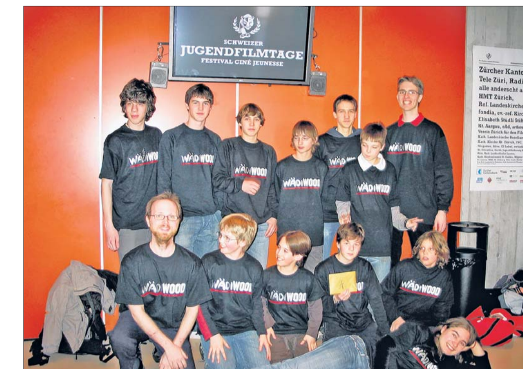
Die Film-Jugendgruppe Wädiwood feiert an den Jugendfilmtagen ihren ersten nationalen Erfolg. (zvg)

«Die Konkurrenz war sehr stark. Daher freut es uns besonders, dass unser Film die zu Hunderten erschienenen Zuschauerinnen und Zuschauer am meisten beeindruckt konnte»,