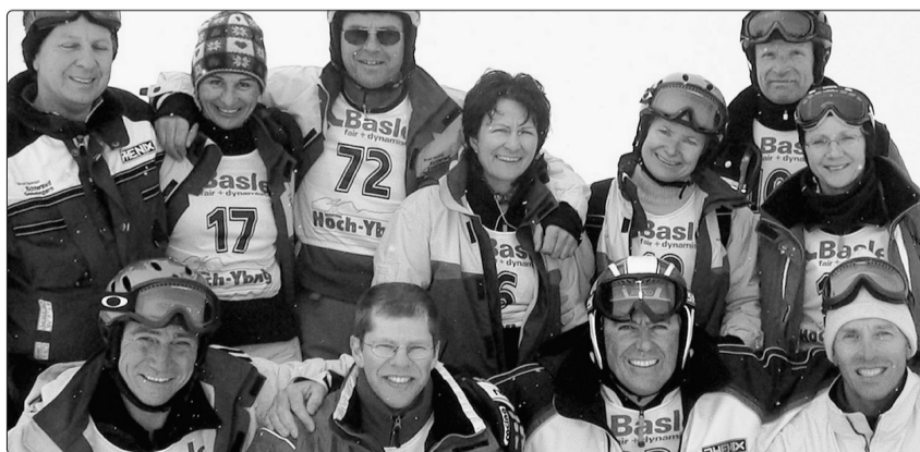
Das Team des SSC freute sich über die guten Resultate auf dem Hoch-Ybrig.

In diesem Jahr mussten die Fahrerinnen und Fahrer zum ersten Mal mit sehr schwierigen Bedingungen zurechtkommen. Der Nebel spielte Katz und Maus mit dem Organisator. So dass dieser den Start dreimal verschieben musste und nur ein Lauf zu-